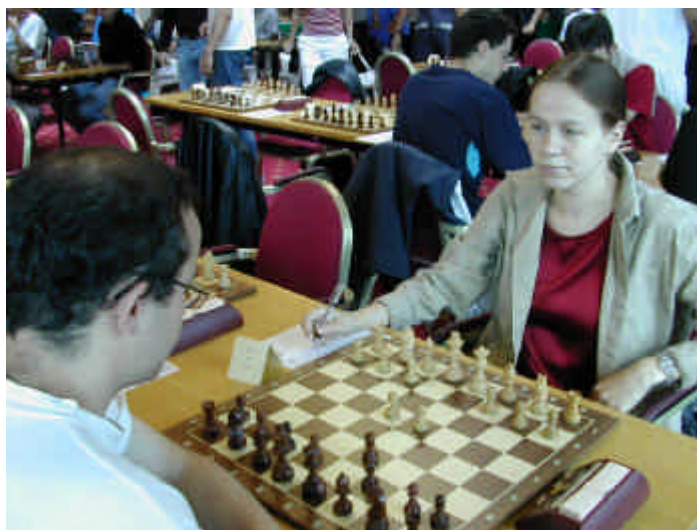
Il Grande Maestro femminile Olga Zimina, alla sua prima apparizione al Festival di Bratto.